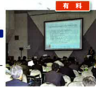
Co: コーディネーター、S: スピーカー (敬称略)